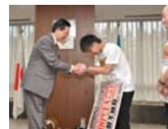
岩手県庁 2012年11月5日(月)

■復興支援金寄付先とご対応下さった方 岩手県庁 遠増拓也 岩手県知事 ■復興 寄付金 5,000,000円