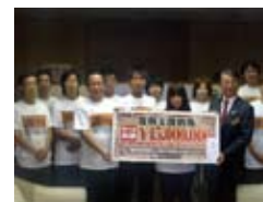
宮城県庁 2012年11月6日(火)

■復興支援金寄付先とご対応下さった方 宮城県庁 三浦秀一 宮城県副知事 ■復興 寄付金 5,000,000円