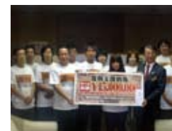
宮城県庁 2012年11月6日(火)

■復興支援金寄付先とご対応下さった方 宮城県庁 三浦秀一 宮城県副知事 ■復興 寄付金 5,000,000円