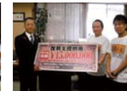
福島県庁 2012年11月5日(月)

■復興支援金寄付先とご対応下さった方 宮城県庁 三浦秀一 宮城県副知事 ■復興 寄付金 5,000,000円