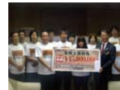
宮城県庁 2012年11月6日(火)

■復興支援金寄付先とご対応下さった方 宮城県庁 三浦秀一 宮城県副知事 ■復興 寄付金 5,000,000円