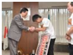
岩手県庁 2012年11月5日(月)

皆様からご愛顧頂きました復興支援酒場は平成25年7月31日の銀座店閉店をもちまして今回の役目を終えることとなりました。この酒場へ関わって下さった全ての方々へ御礼を申し上げます。ありがとうございました。そして復興支援酒場を支えて下さった素晴らしい民族「日本人」であることを誇りに思います。